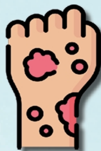
Сыпь и покраснения кожи