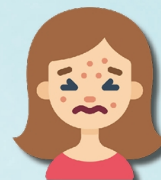
Зуд в носу и глазах